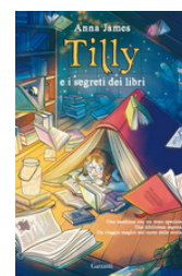
Tilly e i segreti dei libri James