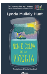
Non è colpa della pioggia Hunt