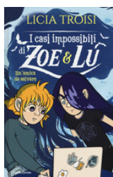
I casi impossibili di Zoe & Lu. Un'amica da salvare Troisi