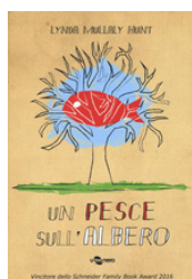
Un pesce sull'albero Hunt