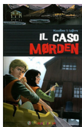
Il caso Morden Nicodème • Lefèvre