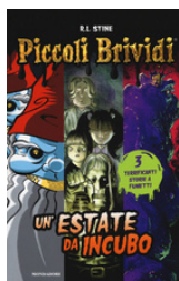
Un'estate da incubo Stine