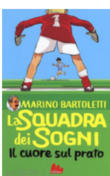
Il cuore sul prato Bartoletti