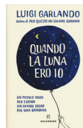
Quando la luna ero io Garlando