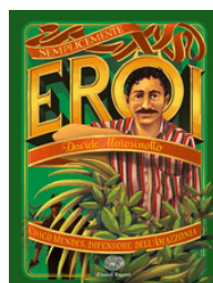
Chico Mendes, difensore dell'Amazzonia Morosinotto