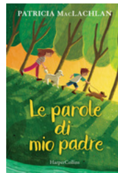
Le parole di mio padre MacLachlan