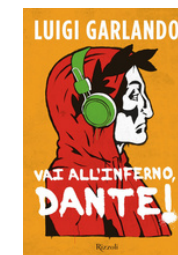
Vai all'Inferno, Dante! Garlando