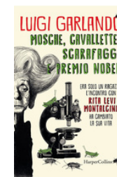
Mosche, cavallette, scarafaggi e premio Nobel Garlando