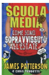
Scuola media. Come sono sopravvissuto all'estate Patterson